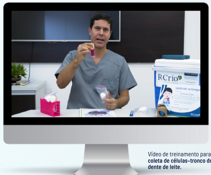
Vídeo de treinamento para coleta de células-tronco do dente de leite.